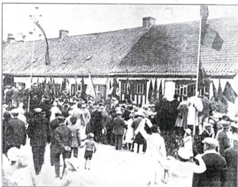
Het huis te De Panne waar Leopold I in 1831 de Belgische kroone aanvaardde (gegricht bij de herovername in 1890).

Over een Franschen prins, een Bourbon, op den Beierischen troon, waarna de meerochteden van wege niet te spreken. Zij immers banden het Rijk der Nederlanden insgelijks als een daga ter bevestiging van Frankrijks expansiebeleid. De Beierische revolutie hadden ze dan ook niet tegenin als een volkomen feit aanvaard. Dat de nieuwe staat bij Frankrijk zou worden inlijfd.