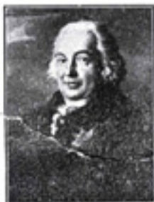
FRANZ, Hertog van NEMOURS-Coburg, vader van Leopold I.

Toen dan voor een goed deel onder den invloed van die vrees, het nationaal Congres zich voor de constitutionele, parlementaire, erfenische monarchie had uitgesproken, viel de eerste krunge op den hertog van Nemours, zoon van den Franschen