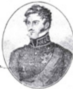
PRINCE LEOPOLD VAN SAKSEN-COBURG-GOETHA.