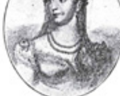
PRINCESS CHARLOTTE VAN WALES, eerste echtgenote van Leopold.

De bondgenooten leden echter te Austerlitz, te Jena en te Averstedt de nederlaag en het hertogdom Saksen-Coburg werd, krachtens het verdrag van Tilsit (1807) aan Frankrijk toegewezen. Hertog Frans stierf, kort daarna van vrodriet. Leopold sluit hem de oogen en vervoegt dan het Russische leger, het emble dat op het vasteland, den Keiser nog weerstaat. Zijn naam wordt genoemd na den slag te Lützen (2 Mei 1813) waar hij een aantal charges aanvaardde die een deel van het Fransche leger van de vernietiging reddde. Een paar maanden later 29 en 30 Augustus speelde hij een rol van betekenis te Kulln, in Bohemen, waar hij, met zijn corps, twee dagen lang een bergpas, die van buitengewone strategische betekenis was, met de intense haardnacktheid verdedigde. Na aan den vierdaagchen slag bij Leipzig (16-18-20 October 1813) een werkzaam aandeel te hebben genomen rukte hij mee de Fransche grens over. Den 26sten Maart trok hij, aan de zijde van tsaar Alexander, Partij binnen. Later reide hij, steeds in het gevolg van deen voert naar Londen.