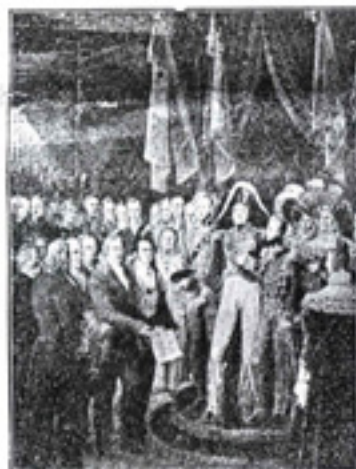
De afzwaaiing van het Nieuwste Congres bleef de Belgische vrees van den Franschen Koning Louis-Philippe (17 Februari 1831).

Aanvankelijk lejde de regent zich niet zonder meer naar bij het verzet van zijn dochter, maar de regering, het hof, de publieke opinie waren den prins gezegen en in 1816 werd Leopold zelf door den regent naar Engeland onthouden. Den 2den Mei van dat jaar werd het huwelijk voltrokken. De jonge prins van Saksen-Coburg werd hertog van Kendall, gemoet al de rechten van een Europech burger en al de voorrechten van een lid der Engelsche koninklijke familie. Daarbij wees