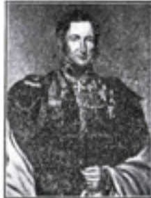
ALBERT, hertog van Saksen-Coburg-Gotha, broeder van Leopold I.

Daar stelt de toos hem voor aan prinsess Charlotte, dochter van den toenmaligen ergrans prins George van Wales en vermoedelijke erfgename van de Britsche kroon. Charlotte was door haar vader voorbestemd de echtgenoot te worden van den prins van Oranje, zoon van Willem I dien we van 1815 tot 1830 koning van het Rijk der Nederlanden zullen zien. De jonge vrouw bleek echter niet zinnig zich zoo naar te laten uithuwelijken. Ze was zelf haar levensgenoot kien, en haar keuze viel op Leopold die, op die maaker voor het eerst, het Rijk van Oranje in de welen reed.